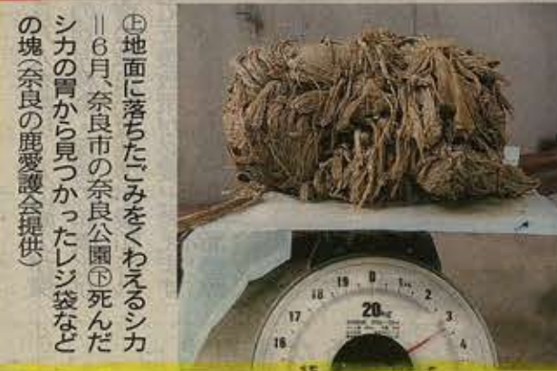
④地面に落ちたごみをくわえるシカ。6月、奈良市の奈良公園で死亡したシカの胃から見つかったレジ袋をこの塊。